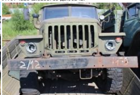
УРАЛ-43202 ш.Л0138410 дв.526656