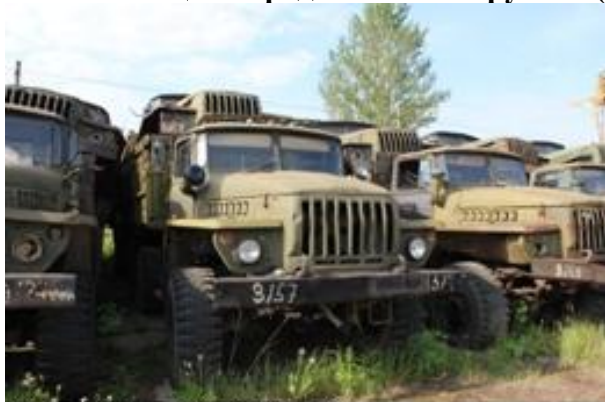
УРАЛ-43202 ш.М0173354 дв.б/н

Начальная цена продажи: 84 108 рублей (с учетом НДС)