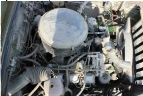
УРАЛ-43202 ш.М0173354 дв.б/н

Лот (предписание 15.0004 (п. 320)), прием заявок по 21 мая 2015 г.