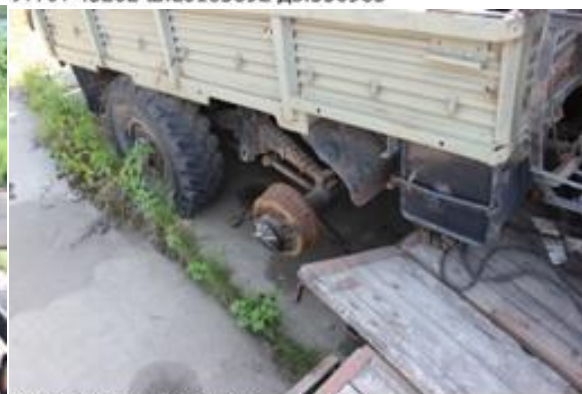
УРАЛ-4320 ш.Р0205847 дв.04500