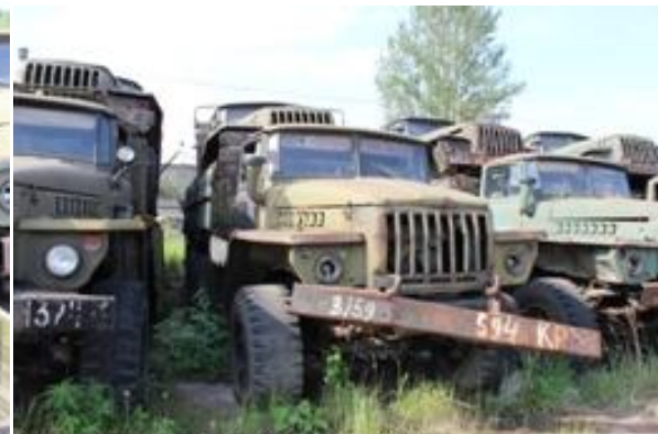
УРАЛ-43202 ш. P0206987 дв. 062005