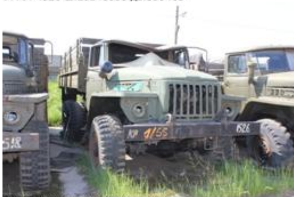
УРАЛ-43202 ш.Л0100105 дв.б/н