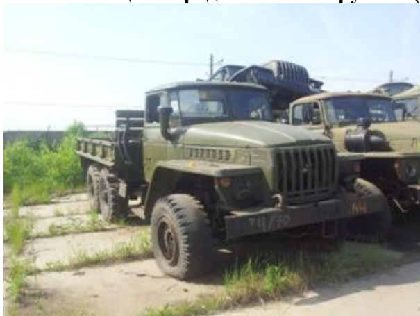
УРАЛ-4320 ш.І0107154 дв.328040

Начальная цена продажи: 84 108 рублей (с учетом НДС)