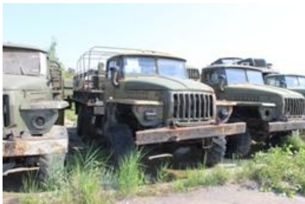
УРАЛ-4320 ш. 083856 дв. 6/н