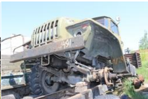
УРАЛ-43203 АБШ ш. K0115494 дв. 385307