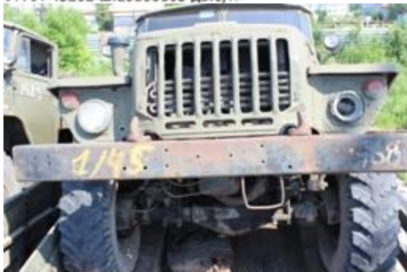
УРАЛ-4320 ш.К0125049 дв.170590