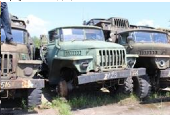
УРАЛ-4320 ш.0201719 дв.902427