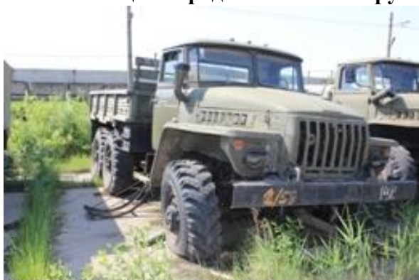
УРАЛ-4320 ш.Л0146688 дв.599465

Начальная цена продажи: 7 822 044 рубля (с учетом НДС)