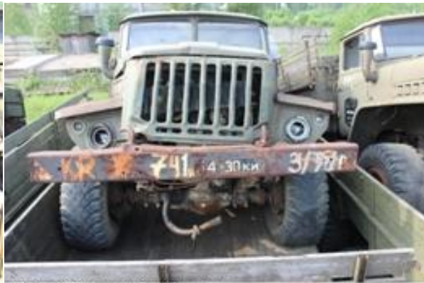
УРАЛ-43202 ш. 083584 дв. б/н