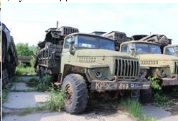
УРАЛ-4320 ш. N0205313 дв. 035687