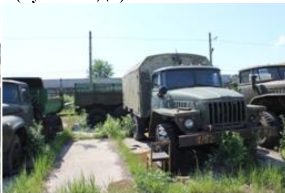
УРАЛ-43203 АБШ ш.М0191835 дв.701199