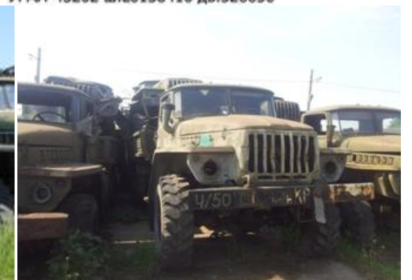
УРАЛ-4320 ш.К0127584 дв.441349