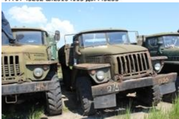
УРАЛ-43202 ш.085091 дв.658096