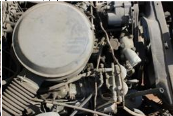
УРАЛ-4320 ш. L0102838 дв. 283539

Лот (предписание 15.0004 (п. 108)), прием заявок по 21 мая 2015 г.