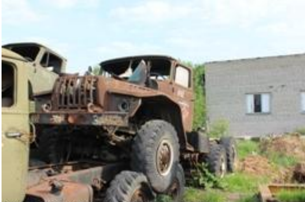
УРАЛ-4320 АБШ ш. R0217408 дв. 05377