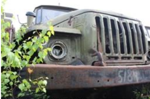
УРАЛ-4320 ш. L0156939 дв. б/н