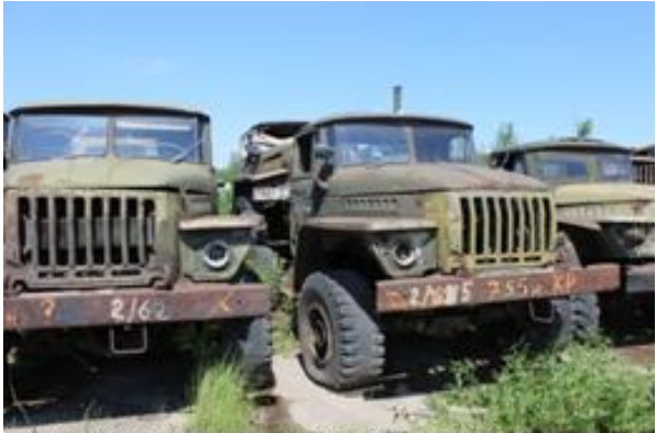
УРАЛ-43202 АБШ ш. L0145448 дв. 044866