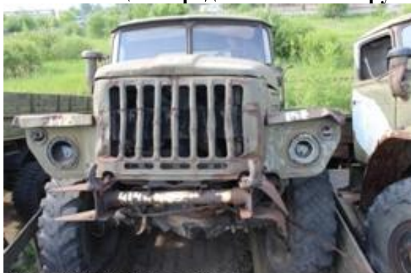
УРАЛ-4320 ш. 016985 дв. 484535

Начальная цена продажи: 19 972 284 рубля, с учетом НДС