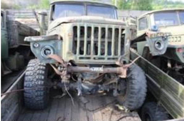
УРАЛ-43202 ш. 024340 дв. 600049