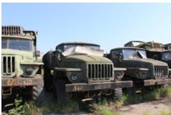
УРАЛ-43202 ш. L0153147 дв. 020356