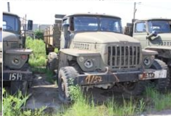
УРАЛ-43202 ш.Л0103892 дв.350985