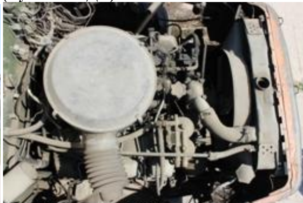
УРАЛ-4320 ш. M0176888 дв. 803325