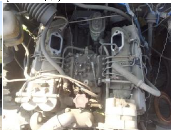
УРАЛ-4320 ш.І0107154 дв.328040