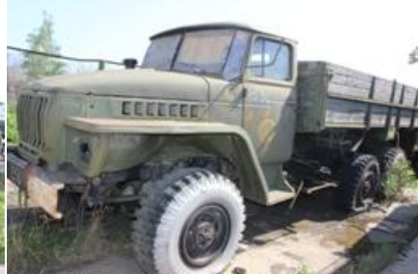
УРАЛ-43202 ш. 10100925 дв. 281341

Лот (предписание 15.0004 (п. 95-107, 109-214, 216-319, 321-335)), прием заявок по 22 мая 2015 г.