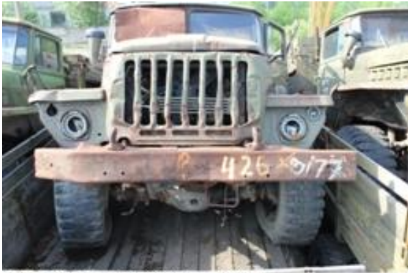
УРАЛ-43202 ш. N0192202 дв. 333470