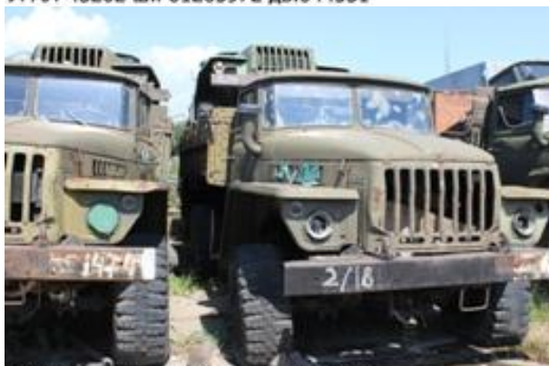
УРАЛ-43202 ш.Л0104115 дв.443233