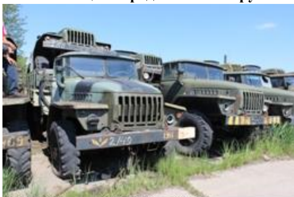
УРАЛ-4320 ш. M0176888 дв. 803325

Начальная цена продажи: 84 108 рублей. (с учетом НДС)