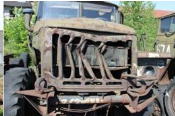
УРАЛ-4320 АБШ ш. I0106638 дв. б/н