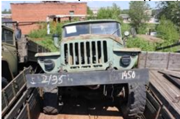
УРАЛ-4320 ш. L0102838 дв. 283539

Начальная цена продажи: 84 108 рублей (с учетом НДС)