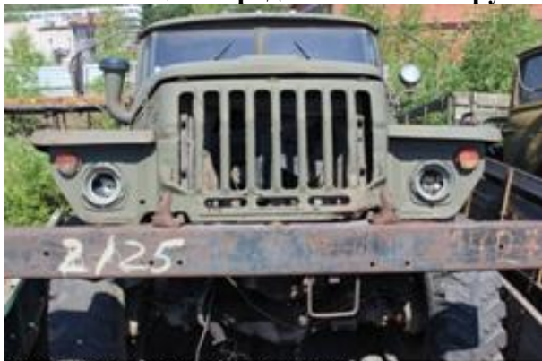
УРАЛ-43202 ш.Р01205972 дв.044551

Начальная цена продажи: 1 682 160 рублей (с учетом НДС)